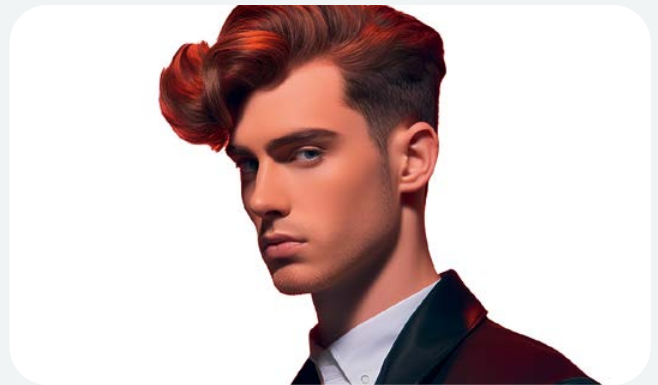
Bilder generiert mit Bildgenerator Midjourney/Clipdrop