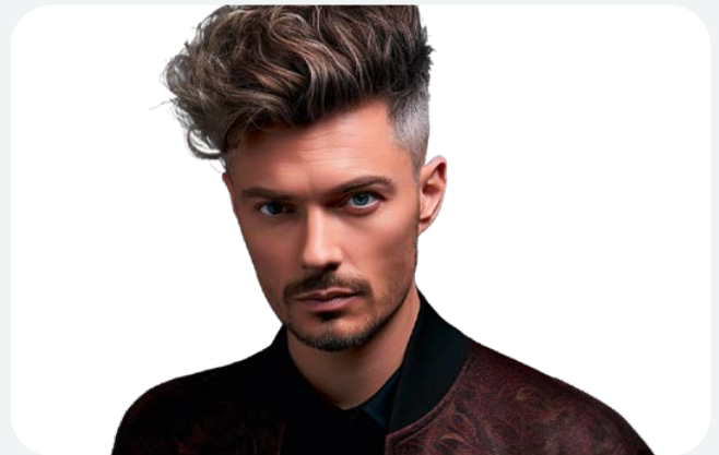
Bilder generiert mit Bildgenerator Midjourney/Clipdrop