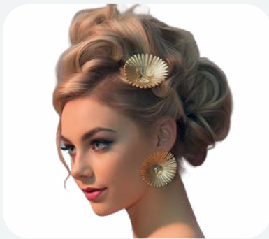
Bilder generiert mit Bildgenerator Midjourney/Clipdrop